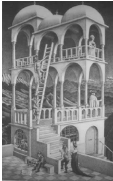
M. C. Escher's "Belvedere" (c) 2002 Cordon Art-Baarn-Holland. All rights reserved. Used by permission www.mescher.com.